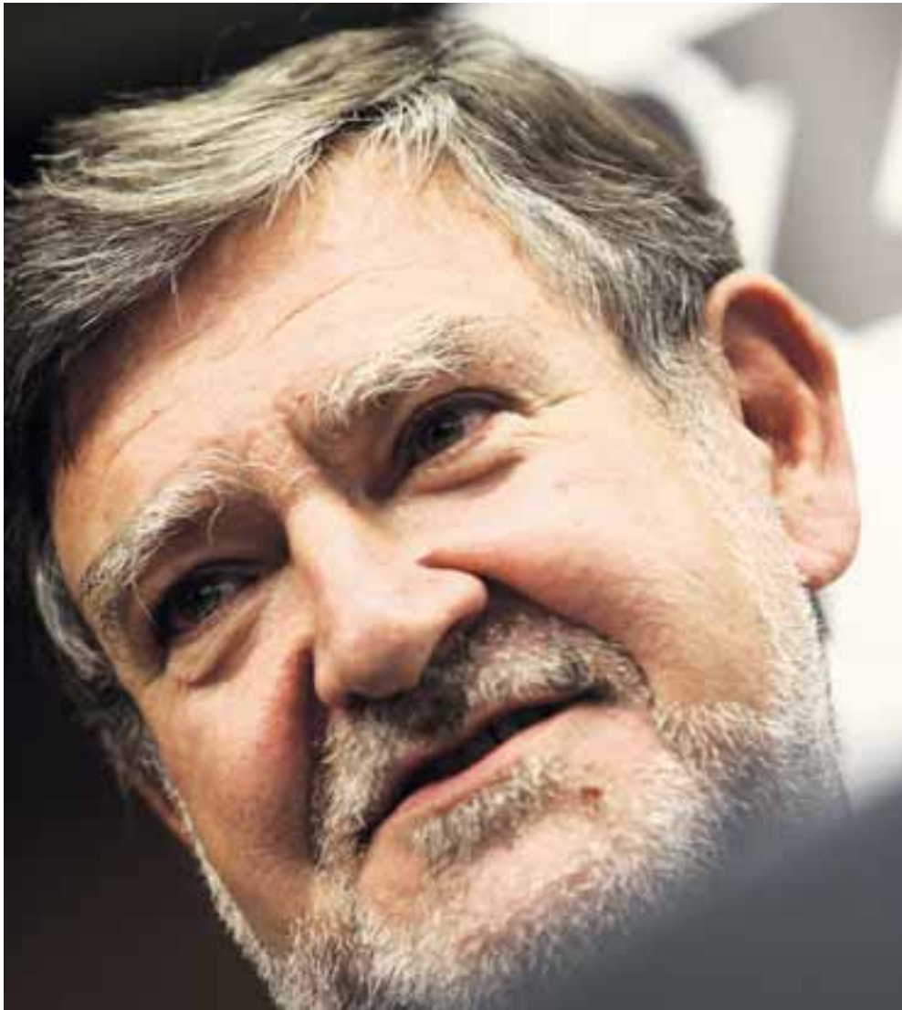
RI-Boss Herbert Stepic sieht fusionierte Bank mit ausreichend Kapital ausgestattet

Herausgelöst werden aus der RZB die Raiffeisen Centrobank, das Leasing-Geschäft,